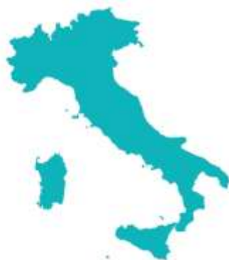
Distribuzione per grado scolastico (%) a.s. 2016/2017