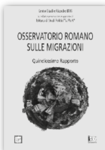
OSSERVATORIO ROMANO SULLE MIGRAZIONI. XV RAPPORTO