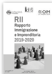
RAPPORTO IMMIGRAZIONE E IMPRENDITORIA 2019-2020

Consultare il nostro catalogo è facile. Potrai acquisire le nostre ultime pubblicazioni, e non solo, nel formato cartaceo e in PDF